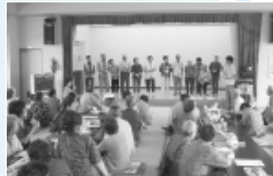
6月4日(金) 守門高齢者センター 広神・守門・入広瀬地区 高齢者交流会