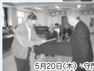
5月20日(木) 守門庁舎にて