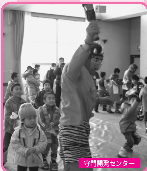
守門開発センター

豆まきの由来をお聞きしたあと、赤鬼・青鬼が突然乱入でおお泣きする子どもたち。泣きながらも「鬼は外！」と豆を果敢にぶつける姿を見ながら保護者もスタッフも思わずもらい泣き笑いでした。毎年好評の餅つきも、白の廻りに餅つきの順番待ちが出来るほどでした。