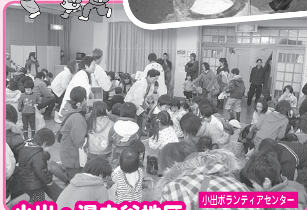
小出・湯之谷地区

親子連れや祖父母に付き添われた子どもたちが集まり、かむろ真鶴ダンススクールのインストラクターによる元気いっぱいの体操に合わせウォーミングアップをし、体が温まったところで豆まきを始めました。赤鬼や青鬼の登場で、一層豆まきが盛り上がりました。参加者は174人と例年よりも少なかったですが、毎年楽しみにしているという意見を多くいただきました。