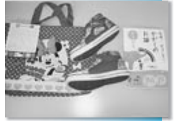
子どもたちへのプレゼント

なお、引き続き義援金の募集を行っておりますので、お近くの社会福祉協議会各支所にお寄せいただきますようお願いいたします。