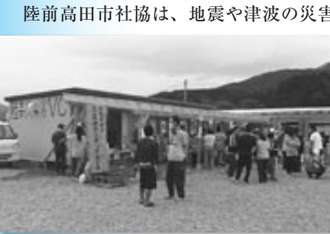
プレハブ造りの災害ボランティアセンター

5月下旬から、「社会福祉協議会における災害救援活動に関する相互支援協定」に基づき、岩手県陸前高田市社協へ職員派遣を実施しています。