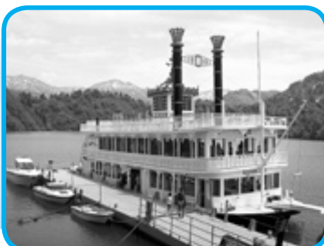
豪華客船ファンタジア号