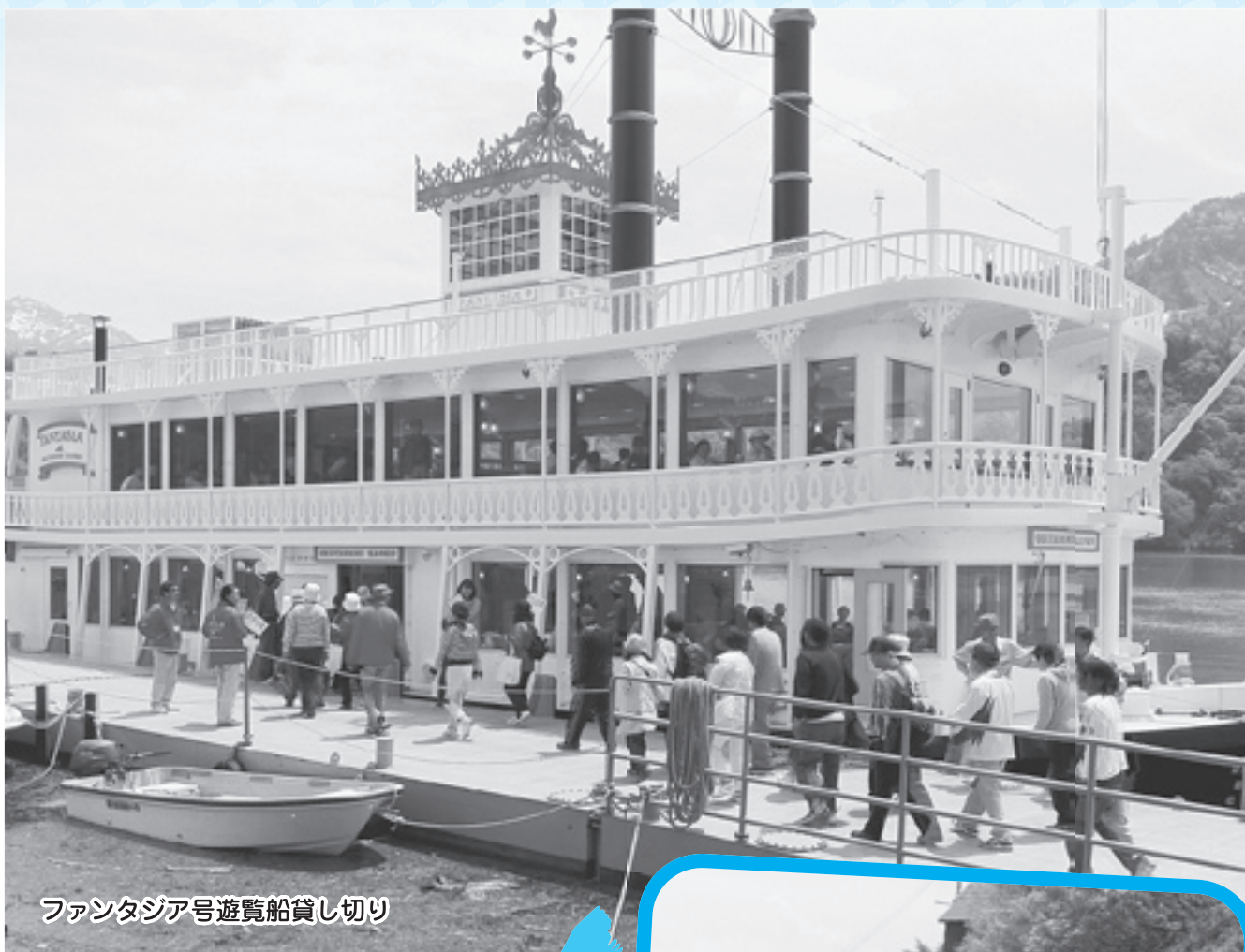
ファンタジア号遊覧船貸し切り