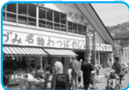
ターミナルでゆっくりと…