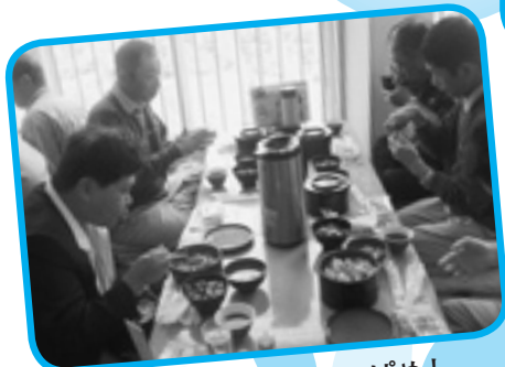
おいしい！山菜わっぱめし