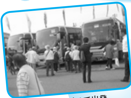
さあ、大型バスで出発