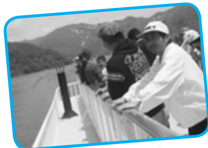
湖上の風、さわやか～