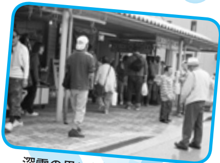
深雪の里に帰ってきました！