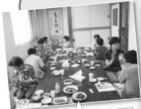
♪あながたどこさ♪をやっています 大板山楽茶の会の皆様

特別なことをしなくても、みんなが寄れば、楽しさ倍増！ あなたの地域でも、始めてみませんか。