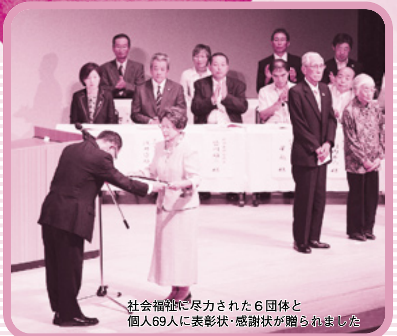
社会福祉に尽力された6団体と 個人69人に表彰状・感謝状が贈られました