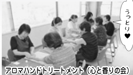
アロマハンドトリートメント（心と香りの会）

そのほか… ストレスチェック・アルコールパッチテスト お口の健康相談・介護予防PRもありました！