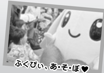
ふくびい、あ・そ・ぼ♥

し 信じよう!みんなの力 あ あなたはあなたらしく わ わたしはわたしらしく せ 生活できる あったか地域づくり