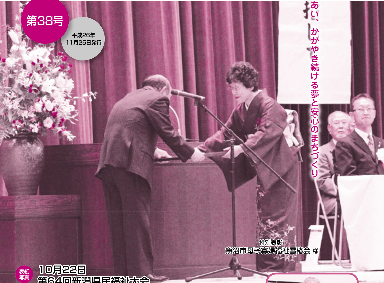
特別表彰 魚沼市母子寡婦福祉雪椿会 様