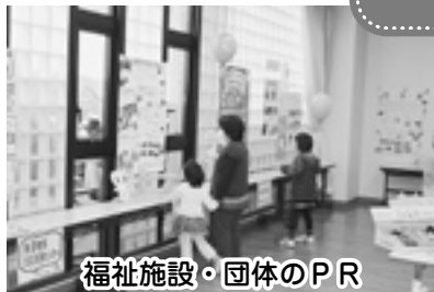
福祉施設・団体のPR