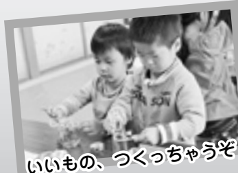
いいもの、つくっちゃうぞ!

手話教室 (魚沼市手話サークル) ゲートボール交流 (魚沼市ゲートボール連盟) 福祉施設出店スタッフ体験もありました!