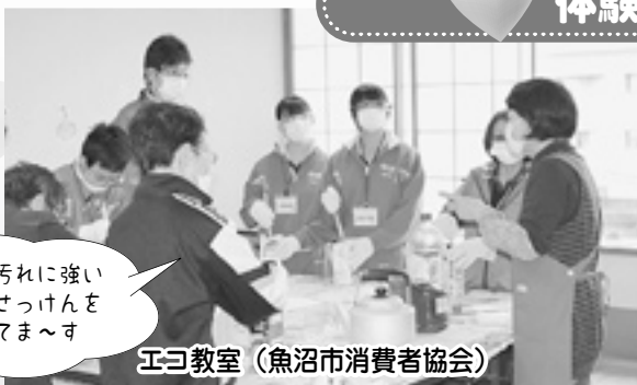
エコ教室 (魚沼市消費者協会)