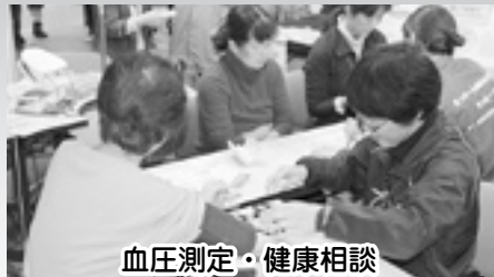
血圧測定・健康相談