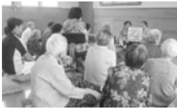
地域友愛ボランティア1班 (小出稲荷町)

小出地区地域友愛ボランティアの会は、様々な人たちと知り合ったり、協力し合うことで、人とのつながりを広げていくことを大切にしています。