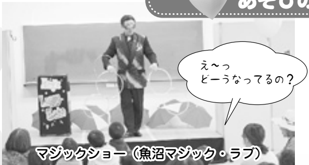
マジックショー (魚沼マジック・ラブ)