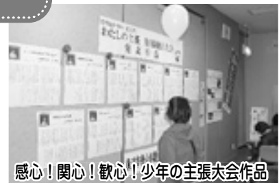
感心！関心！歓心！少年の主張大会作品