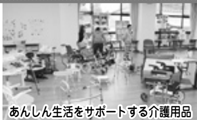
あんしん生活をサポートする介護用品