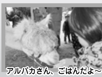
アルパカさん、ごはんだよ〜