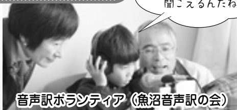
音声訳ボランティア (魚沼音声訳の会)