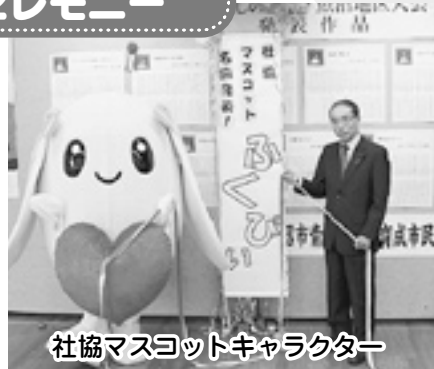
社協マスコットキャラクター