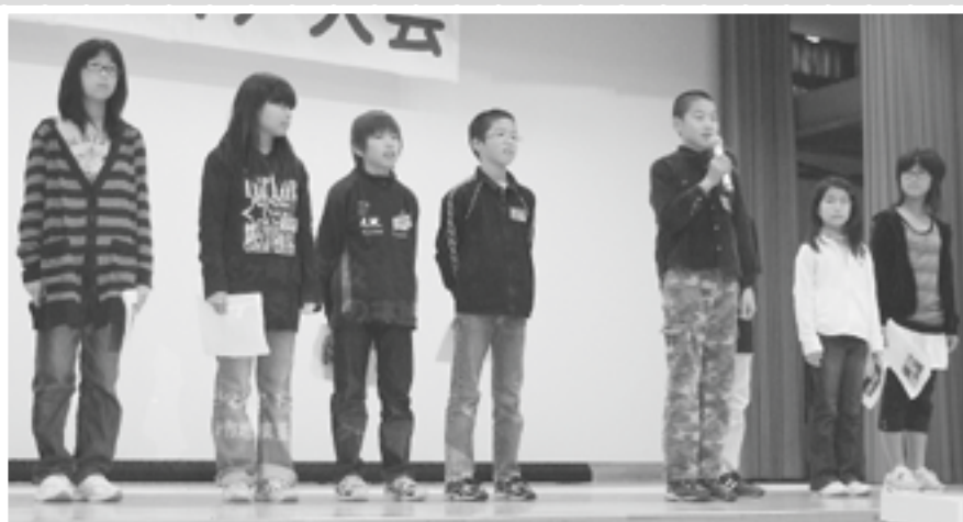
伊米ヶ崎小学校の皆さん