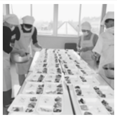
守門健康センターより愛を込めて…

私たち調理ボランティアは、守門ボランティアの会に所属し、現在26人が2班に分かれて活動をしています。