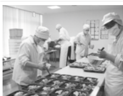
ひろかみ工芸の利用者と盛り付け中!!