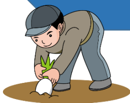
農園での農業体験