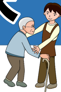
福祉施設での介護体験