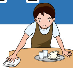
飲食店での接客体験