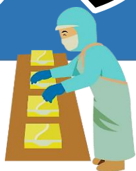
工場での製造・加工体験