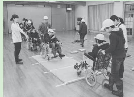
一人では難しいことも介助者と一緒に行えばできることを実感