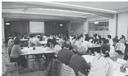
当日は66名の参加がありました

最後に講師からの呼びかけにより、今後、身寄りなし問題を考える勉強会を定期的に開催することとなりました。みなさんもぜひ一緒に考えていきませんか。興味のある方は、当会までご連絡ください。