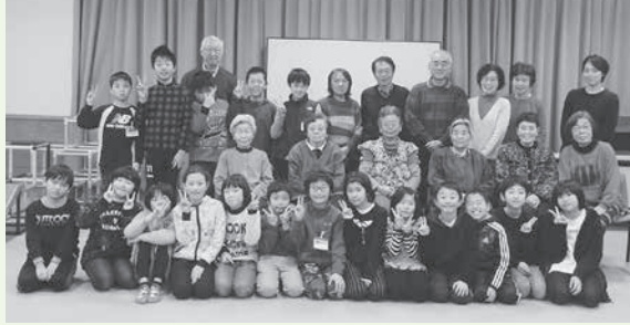
楽しく交流できました

最初は、「何をしたらいいか」と、ぎこちない姿が見られました。回数を重ねることに自然と参加された地域の皆さんと会話を楽しんでいました。