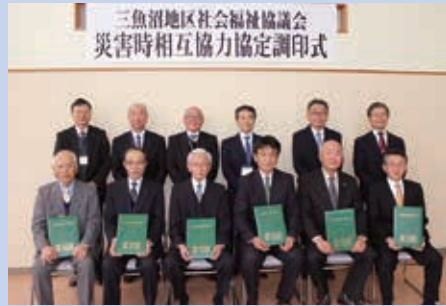
三魚沼地区社会福祉協議会 災害時相互協力協定調印式

締結式には関係社協の会長が出席し、これを機に、相互の連携強化を深めてゆくことを確認しました。