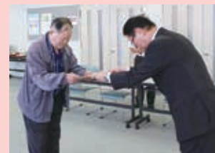
隣保館福祉作業所 様

昨年、市民の皆様からご協力いただきました、赤い羽根共同募金を財源とした広域助成金を交付しました。