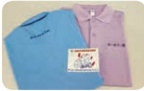
『安心・安全・地域の支え合い支援事業』の助成金で作成しました。

住民同士がお互いさまの気持ちで生活を支え合う活動『あいほうし隊』の活動者を募集しています。