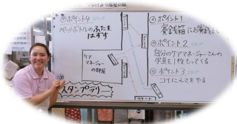
スタンプラリーのコースです！