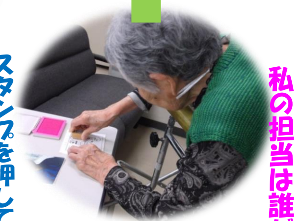
スタンプを押しつづける