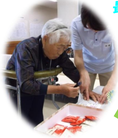
最後にお菓子を取って…