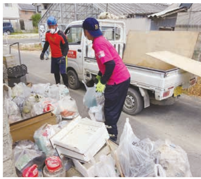
不用物の積み込み