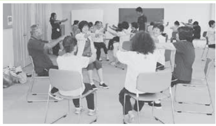
簡単な体操を実施