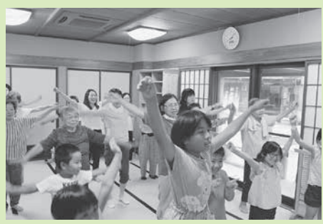
地域の茶の間事業（雪華の会）