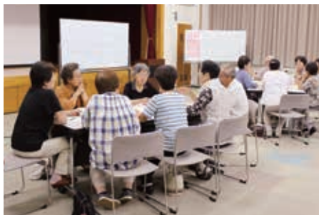
グループで意見交換

それぞれ活動している地域の茶の間も地区によって実施内容は様々です。そこで、「お隣」の茶の間を知ることで自分達の活動に活かしていただくことを目的に、連絡会を開催しました。市内6地区を会場に、普段どのように茶の間を運営しているか、情報・意見交換を行い、内容や悩みを共有しました。 また、エンジョイススポーツクラブ魚沼様から茶の間でできるレクリエーションを教えてください。参加者からは、「他の地域の様子を聞けて参考になった。」「脳トレを今後役立てたい。」との感想があり、有意義な連絡会となりました。