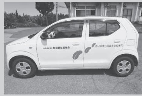
広域助成の配分を受けて車輛を購入（魚沼更生福祉会様）