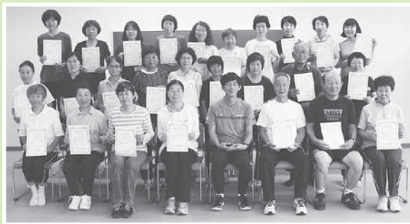
地域での活躍が期待されます