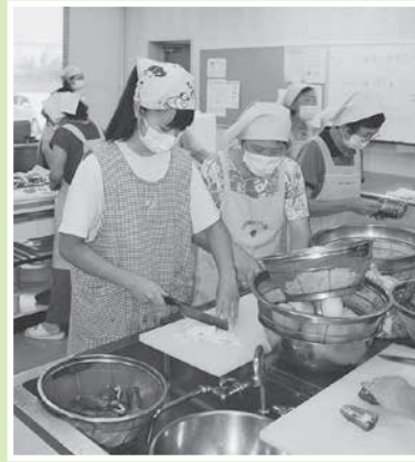
慣れない手つきで包丁を握る中学生

小出中学校の生徒が8月24日、『ふれあい配食サービス事業』の体験をしました。ベテランのボランティアさんから指導してもらいながら、約150食のお弁当を作り、高齢者や障がい者の元へ届けられました。 『ボランティアスクール』は、他にも、地元にある福祉施設やボランティア団体を知り、体験を通して福祉を身近に感じ、考えるきっかけづくりを目的として市内各地で毎年実施しています。