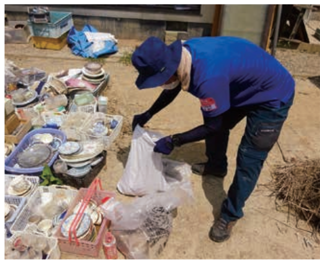
大切なものや使えるものを選別