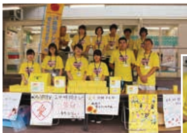
ご協力ありがとうございました