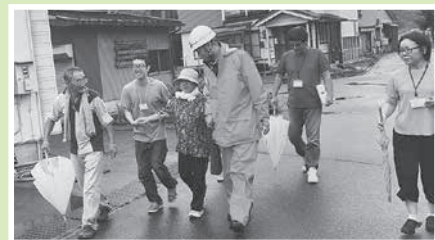
無事発見して一緒に帰る様子

参加された皆さんは、「もし自分だったら。」「上手な声かけの方法は。」など、認知症の方への接し方を考えさせられた貴重な機会となりました。