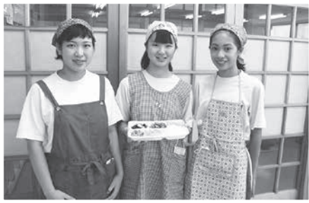
美味しいお弁当ができました！

小出中学校の生徒が8月24日、『ふれあい配食サービス事業』の体験をしました。ベテランのボランティアさんから指導してもらいながら、約150食のお弁当を作り、高齢者や障がい者の元へ届けられました。 『ボランティアスクール』は、他にも、地元にある福祉施設やボランティア団体を知り、体験を通して福祉を身近に感じ、考えるきっかけづくりを目的として市内各地で毎年実施しています。