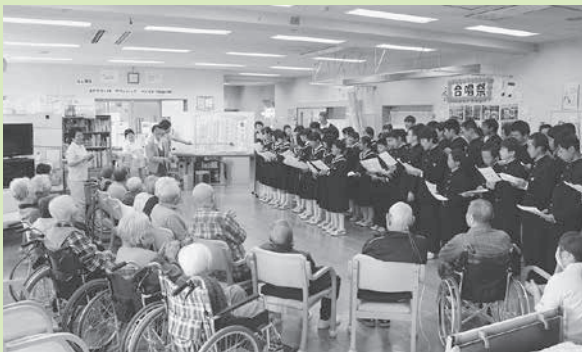
守門中学校の皆さん、ありがとうございました

初めての合唱祭でしたが、施設内が感動と笑顔で包まれ、とても素晴らしいものとなりました。