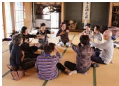
みなさん笑顔で脳トレ