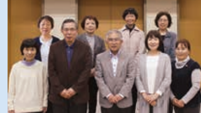
主任児童委員の皆さん

これらの活動を通して、笑顔いっぱい、元気いっぱいの子ども達と地域づくりを、皆さんと共に歩んでいきたいと考えています。