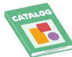
パンフレットカタログ