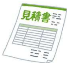
見積書 (相見積もり)