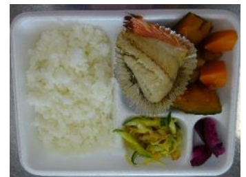
愛情たっぷり♪おいしいお弁当ができました！